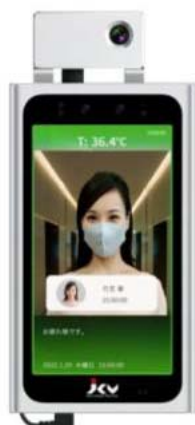
SenseThunder Mini 5.5インチ